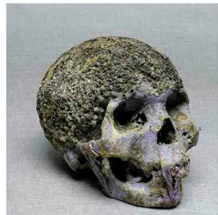
Cadavre, l'œuvre de l'artiste nigérian Olu Oloyede. Le cadavre est une œuvre d'art en terre cuite et est exposé au musée de Lagos.